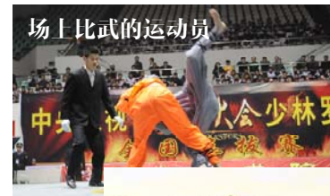
场上比武的运动员

用「 隐喻 」来比喻、描述 主工人 的形象 修词当中用「 隐喻 」来描绘人物、事物及行动