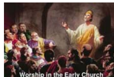
Worship in the Early Church